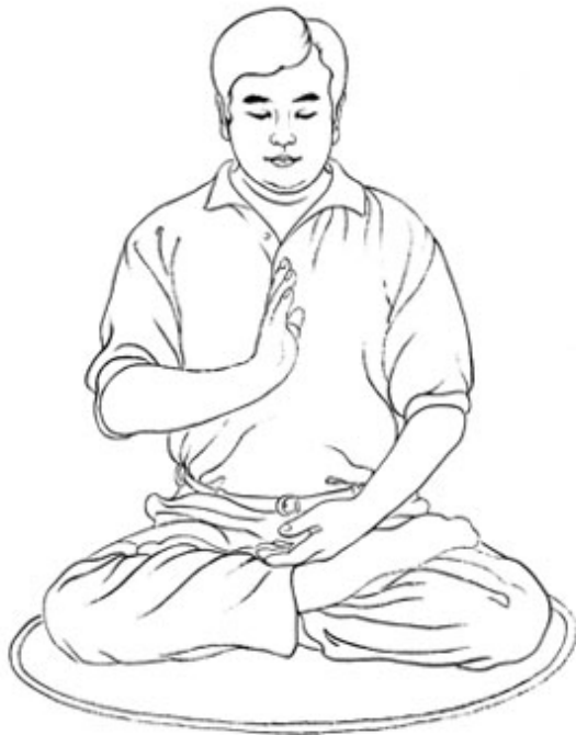
ПОЗИЦИЯ С ОДНОЙ ЛАДОНЬЮ, ВЕРТИКАЛЬНО ПОДНЯТОЙ ВВЕРХ