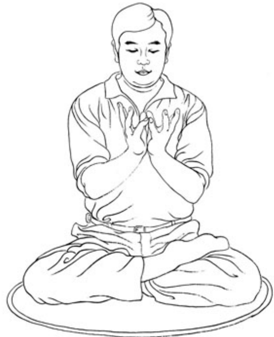
ПОЗИЦИЯ БОЛЬШОГО ЛОТОСА